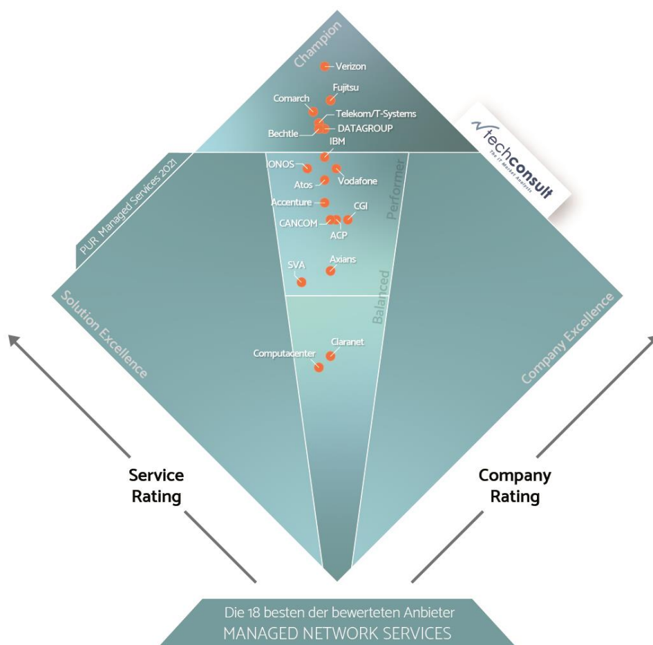
Abbildung 1: PUR-MS Diamant „Managed Network Services“

Im vorliegenden Servicebereich “Managed Network Services” der Anwenderbefragung PUR – Managed Services 2021 konnten sich 18 von 32 marktrelevanten Anbietern einen Platz im Ergebnisdiamanten sichern. Dabei liegen insgesamt sechs Unternehmen im Bereich Champion , angeführt vom Anbieter Verizon . Mit hervorragenden Bewertungen auf Anbieter- und Serviceebene führt Verizon den Ergebnisdiamanten an und zeichnet sich als bestplatziertes Unternehmen für Managed Network Services aus.